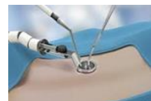
CIRUGÍA MÍNIMAMENTE INVASIVA. LAPAROSCOPIA