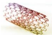
CATÉTERES Y STENTS