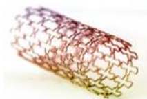
CATÉTERES Y STENTS