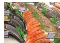
COMERCIALIZACIÓN Y TRAZABILIDAD