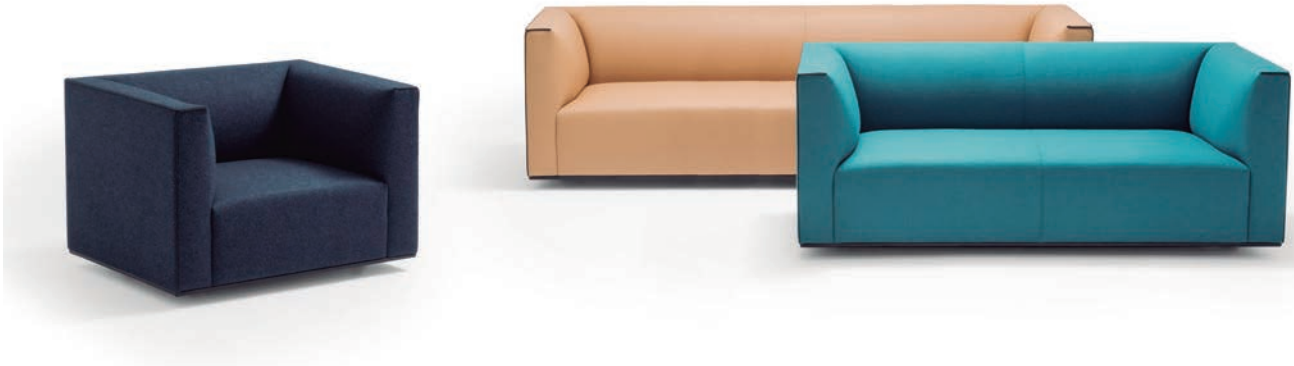
Sofá Grand Raglan diseñado por Piergiorgio Cazzaniga

La sólida apuesta por la I+D, unida al desarrollo constante de nuevos diseños de asientos y mesas contemporáneos —tanto para hogar como para instalaciones— da como resultado que la compañía haya sido la empresa española del sector del hábitat y el mobiliario de diseño con mayor número de diseños industriales registrados en 2017. La marca internacional de mobiliario de diseño contemporáneo se situó también en el segundo puesto del ranking de compañías innovadoras con mayor protección intelectual de sus diseños durante 2017 según la Organización Mundial de Propiedad Intelectual (OMPI).