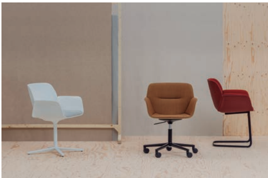
Nuez Chair, diseñada por Patricia Urquiola, distinguida con el “Red Dot Design Award 2018”