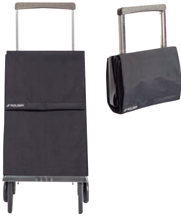
Carro Rolser Plegamatic MF negro