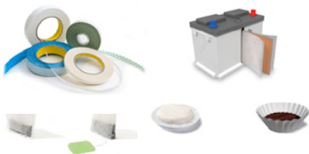
Nuevos productos de la empresa "Terranovapapers" del grupo "Miquel y Costas & Costas"

innovador, ya que el tabaco acababa de llegar de América. Mientras que en el resto de Europa se tendía a consumir tabaco en pipa, en rapé o mascado, en la península ibérica se extendió la afición al liado de cigarrillos, cuando los menos pudientes recogían los restos de tabaco y los fumaban envueltos en papel. Pero para evitar accidentes era preciso que el papel tuviera unas características muy especiales; que fuera muy fino, de bajo gramaje y poroso, así como de una velocidad de combustión adecuada. En Valencia y especialmente en Cataluña se generó una industria alrededor del papel de fumar, dentro de la cual fue creciendo la empresa "Miquel" y posteriormente "Miquel y Costas" fundada en 1879. Tras las guerras napoleónicas, la afición al cigarrillo se extendió por todo el mundo y el papel de liar llamado "catalán" alcanzó gran popularidad. En 1929 se constituyó la actual sociedad anónima.