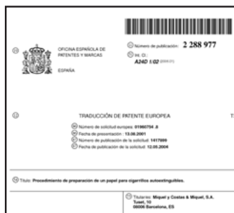
Traducción de la patente europea sobre cigarrillos auto-extinguibles de nº EP1417899