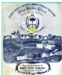
Marca 2207 "Miquel y Costas" 1888, con referencia a la venta en Cuba

. El 83% de las ventas del Grupo las realiza en el exterior y de éstas el 63% fuera de la zona euro